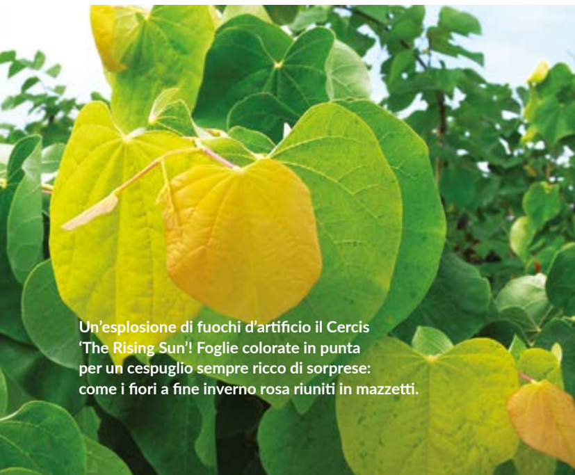
Un'esplosione di fuochi d'artificio il Cercis 'The Rising Sun'! Foglie colorate in punta per un cespuglio sempre ricco di sorprese: come i fiori a fine inverno rosa riuniti in mazzetti.